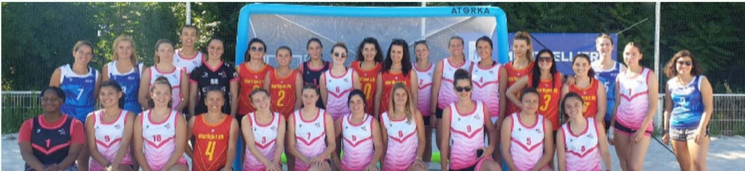
Tournoi HBF3M Parc de la Rauze le 13 juin 2021